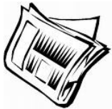
GIORNALE 3-12 MESI