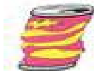
LATTINA DI ALLUMINIO 10-100 ANNI