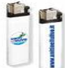
ACCENDINO DI PLASTICA 10-100 ANNI