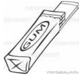
CHEWING-GUM 1-2 ANNI