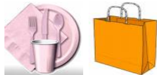
SACCHETTI E PRODOTTI DI PLASTICA 100-1000 ANNI