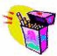
SIGARETTA SENZA FILTRO 3 MESI