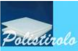
POLISTIROLO 1000 ANNI