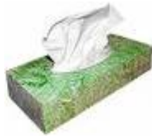
FAZZOLETTI DI CARTA 3 MESI