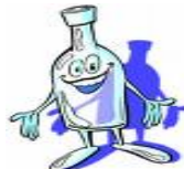
VETRO 4000 ANNI