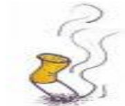
FILTRO DI SIGARETTA 1-2 ANNI