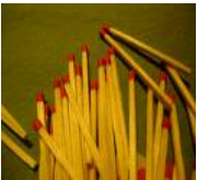
FIAMMIFERI 6 MESI